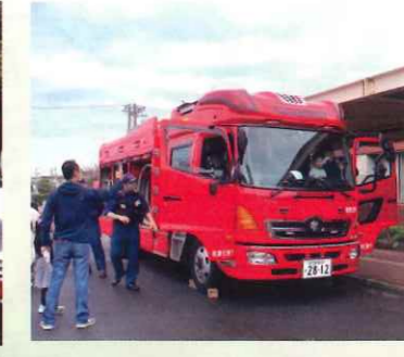
(昨年のもまつり風景)

Stage ステージ Marché マルシェ Working-Car はたらくるま