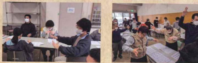
▲さくらまつりに向けて手話の練習に励む利用者さん(^^)

4月イベント「さくらまつり」に向けて着々と準備が始まっています。6日(日)のステージイベント「手話ソング」の練習も始まりました。利用者と職員が心を込めて披露いたします。乞うご期待!