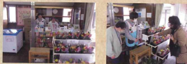
▲笑顔でお迎えいたします

海浜霊園内の売店で商品管理・接客・売上集計等の訓練を行っています。『自分をごまかさない。仕事をごまかさない。』そんな利用者があるままのまっすぐな気持ちで売り場に立っています。苦手なことが多々ありますのでお客様に不快な気持ちをさせてしまうかもしれません。自分たちの出来る精一杯のおもてなしでお迎えておりますのでご配慮いただけたら幸いです。