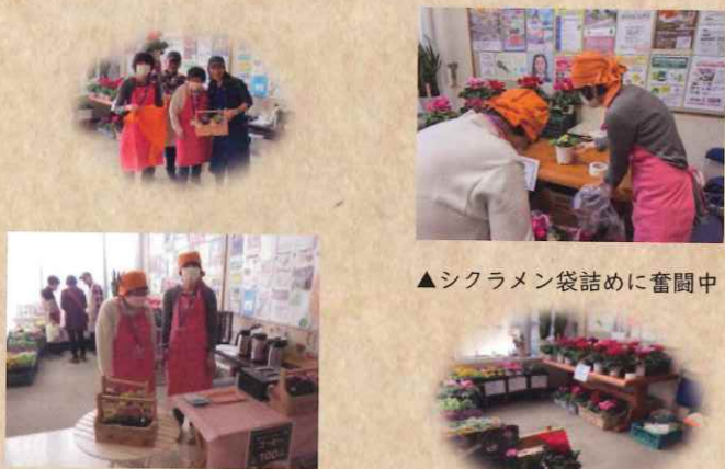
▲シクラメン袋詰めに奮闘中!

天気に恵まれ多くの来場者がありました。夏の高温の影響を受け、年が明けてからようやく花が咲き始めたシクラメン。見ごろを迎えた35鉢をならべました。シーズンが過ぎ売れ行きが心配でしたが、11時から販売開始のバザー会場を華やかに飾り、ぞくぞくと手に取って頂き14時には完売しました!!ホットコーヒーでホッと一息つく方も多く、売り場に立った利用者もお客様に喜んでもらえた!売り切った!という成功体験と達成感を感じたようで今回の販売会も大成功でした。