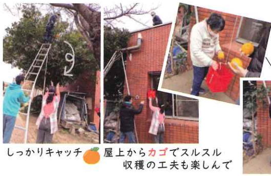
今年300個の実りを お客様に届けました！

毎年大きな実をつける夏みかん。真冬の寒さに晒す前に収穫します。手が届かない高さから渡される実を大切に受け取る声賑やかに響きます。木で完熟した素朴な甘さと酸味は、お客様に期待され、喜ばれている毎年好評の旬の味覚。ポポロマルシェで即日完売。収穫の楽しさと交流に気持ちも和み会話も弾みます。 嬉しいご縁は今、街の笑顔に実を結んでいます。 野菜栽培でお世話になっているヒバリファームのオーナーさんが植樹した夏みかん。5月頃、小さな白い可憐な花が咲き香ります。是非、見に来てくださいね。