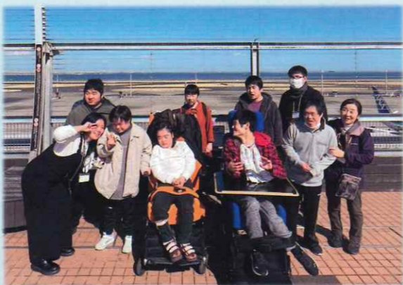
▲展望デッキから飛行機滑走路をバックに集合写真！